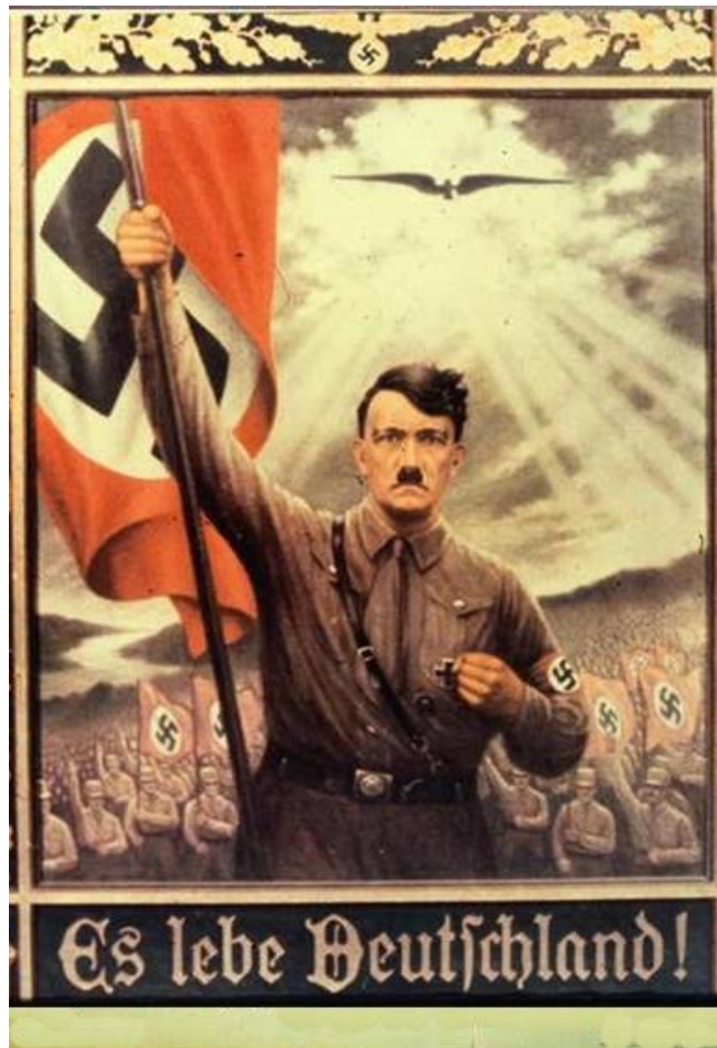
Affiche Hitler. Année 1935

Ceci amènera ensuite l'enseignant, lors de la séance suivante, à conduire la réflexion sur le contexte historique et économique (problématique historique) en interrogeant les élèves sur les raisons qui ont permis à cette affiche d'atteindre son but.